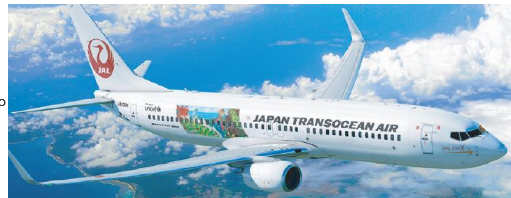
令和5年度図画コンクールにおける飛行機ラッピング