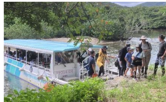
仲間川マングローブ遊覧船ツアーの様子