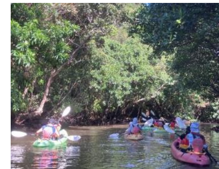
浦内川カヌー体験の様子