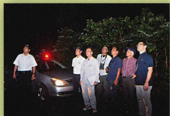
▲盗採防止パトロール