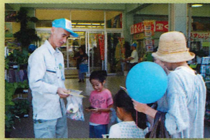
▲アマミノクロウサギ交通事故防止キャンペーン