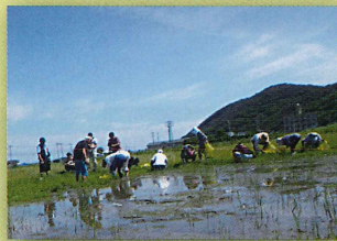
▲外来種の駆除活動