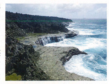
▲台風接近中の沖永良部の海