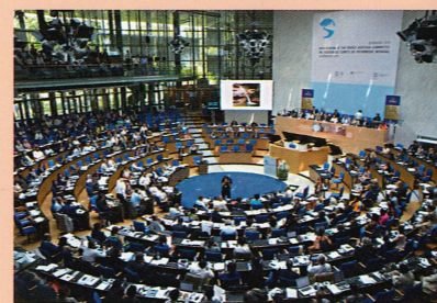
▲第39世界遺産委員会の様子

世界遺産に登録や危機遺産の保護などに関して話し合われる世界遺産委員会は、毎年6、7月頃に開催されています。2015年の第39回世界遺産委員会はドイツのボンで開催されました。次の第40回世界遺産委員会はトルコのイスタンブールで開催されます。