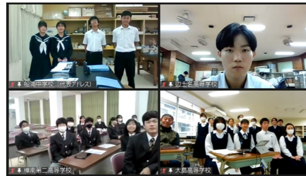
地域連携ミーティングにご参加いただいた生徒の方々