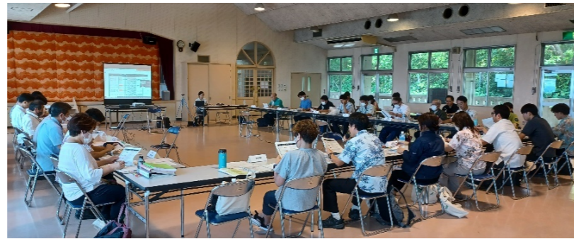
第1回沖縄島北部部会の様子

令和5年度の沖縄島北部部会(事務局:沖縄県自然保護課)を令和5年9月5日(火)及び令和6年2月8日(木)に開催しました。世界自然遺産である「沖縄島北部」の適正な保全・管理の推進に向け、地域で話し合いを行っています。今年度は、エコツーリズム推進全体構想の策定をやるばる3村それぞれで進めながらも連携していく方針が示されるとともに、ケナガネズミなどの希少な野生生物が生活圏に現れたり、交通事故が多く発生していることが共有されました。