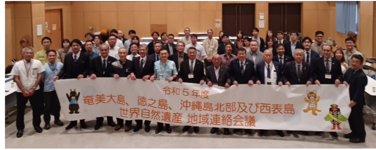
地域連絡会議における写真撮影の様子

令和6年2月21日(水)、世界自然遺産地域連絡会議(事務局:環境省沖縄奄美自然環境事務所)が開催されました。この会議は、世界自然遺産の保全・管理のため関係行政機関間の連絡・調整を図るもので、12市町村が那覇市に集まりました。今年度は、行政機関からの管理状況報告に加え、世界遺産に関する取組を推進・支援している民間団体(世界自然遺産推進共同企業体など)からも取組紹介がありました。