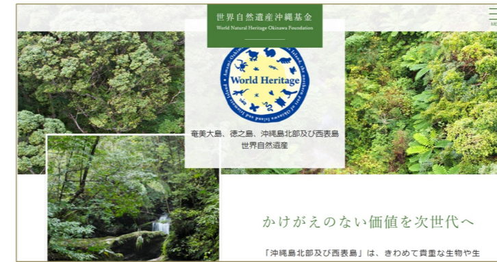
世界自然遺産沖縄基金 HP ( https://churashima.okinawa/wnhof/ )

世界自然遺産沖縄基金は、世界自然遺産推進共同企業体からの要請を受け、一般財団法人沖縄美ら島財団が管理・運営をしています。