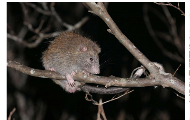
近年ロードキルが急増しているケナガネズミ。夜行性なので、夜間の運転の際に特に注意。