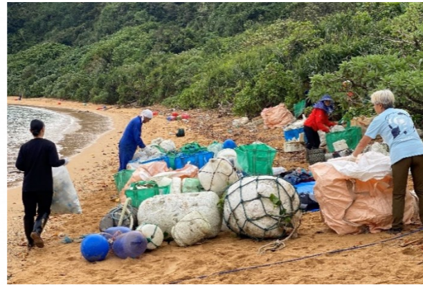
ビーチクリーンの様子

今年度は4件の活動が採択され、ガイドのスキルアップ講習会、ロードキル対策のための草刈り、ビーチクリーン、シンポジウムなどの地域活動が実施されました。来年度も引き続き活動を募集します。多くのご応募をお待ちしています。