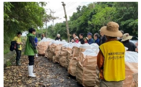
ビーチクリーン後の様子

西表島では今年度、ビーチクリーンや外来生物の駆除作業、ヤマネコをはじめとする野生動物の交通事故防止のための草刈り作業、希少生物持ち出し防止のためのチラシ配布などを行いました。