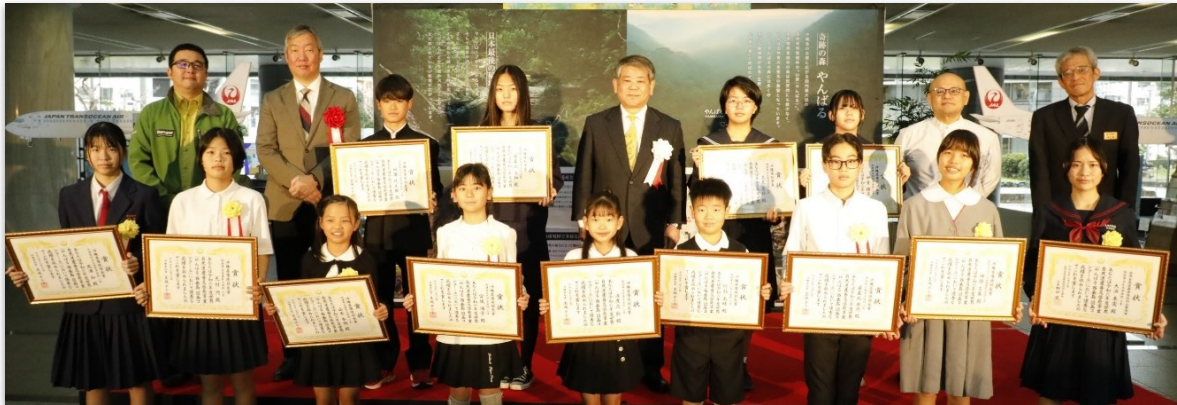
図画コンクールの表彰式の様子（2月3日開催）

八重山地域及びやんばる地域に住む小中学生を対象に募集し、八重山地域では、応募作品 111 点の中から県知事賞 1 点と環境部長賞 5 点、世界自然遺産推進共同企業体賞 1 点が選ばれました。県知事賞の受賞作品は航空機にラッピングされ空を舞い、世界自然遺産となった西表島・やんばるを PR します。