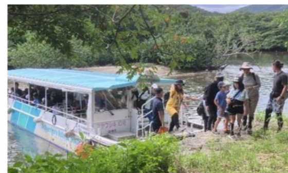
仲間川マングローブ遊覧船ツアーの様子

10月12日には仲間川マングローブ遊覧船ツアー、10月13日には浦内川でカヌー体験を行い、合計で41名の小中学生にご参加いただきました。