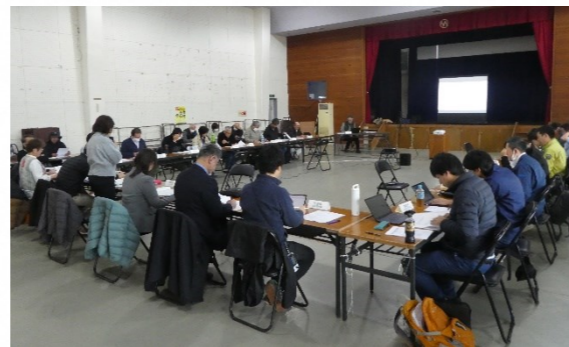
令和6年度第2回西表島部会の様子

今年度は、各機関で実施されているノヤギ対策の取組や、モニタリング評価委員会による評価結果などが報告されました。また、西表島における草刈り作業の重要性について、ロードキルや交通安全上の観点などから、多くの意見が挙げられました。