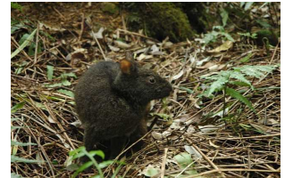
アマミノクロウサギ