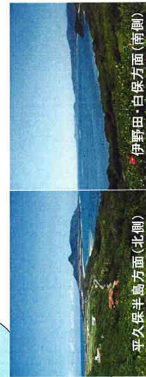
平久保半島方面(北側)