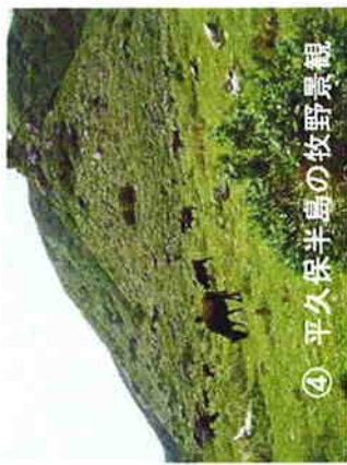
④ 平久保半島の牧野景観