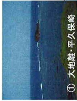
① 大地離・平久保崎