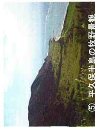
⑤ 平久保半島の牧野景観 (明石園地からの展望)