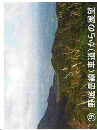
⑨ 野底岳線(車道)からの展望