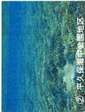
② 平久保海中公園地区