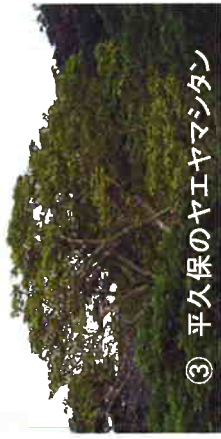
③ 平久保のヤエヤママンタン