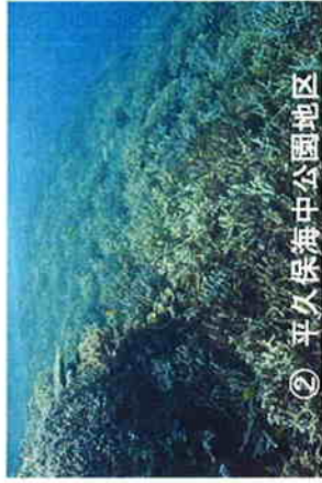
② 平久保海中公園地区