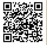
■詳細はこちらから

何万年とこの地で生き残ってきた生き物の命をこれからの未来に繋いでいくことは、この島々に住む我々の使命でもあると思います。ルールへのご理解とご協力をお願いいたします。