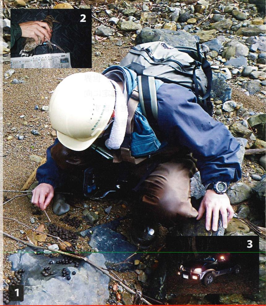
写真1：アマミノクロウサギのフン調査 写真2：アマミヤマシギの足輪標識調査 写真3：ロードセンサスの様子

世界自然遺産登録に向けて、さまざまな取組を加速させていくことが求められる奄美群島。「世界自然遺産登録に向けた取組」と「奄美群島の島々の魅力」を紹介していきます。