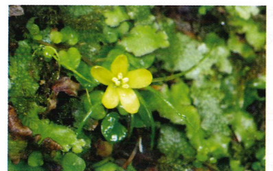
溪流に咲くヒメミヤマコナスビ

森にはあえて厳しい環境に身を置くことで生き残り戦略をとる植物たちがいます。マングローブは真水でも育つことができますが、本来植物が嫌いな塩分を含む汽水域に適応し、生息範囲を広げる戦略をとっています。また溪流沿い植物というグループは、大雨などで定期的に氾濫する川岸で、水流に流されないようサイズを小さくすることで生存を図っています。