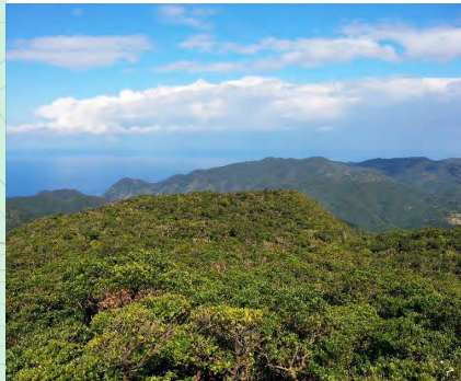
展望台からの眺め

登山道の終着点。山頂付近からの景色が楽しめる他、湯湾岳にまつわる伝説を紹介する看板も。