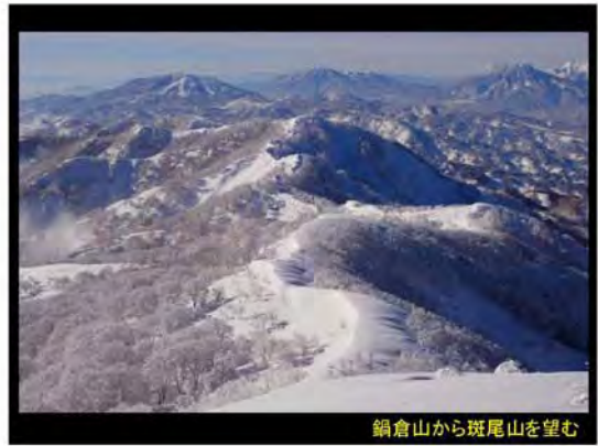
鍋倉山から斑尾山を望む