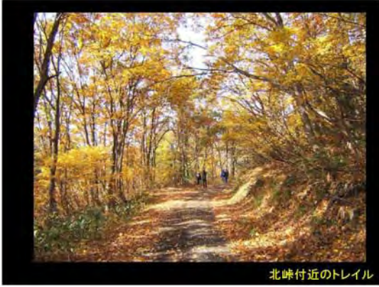
北峠付近のトレイル