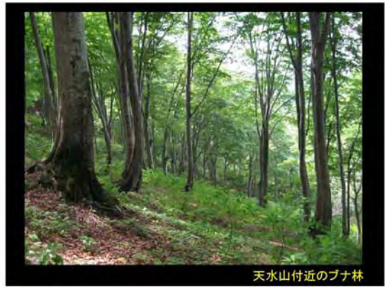
天水山付近のブナ林