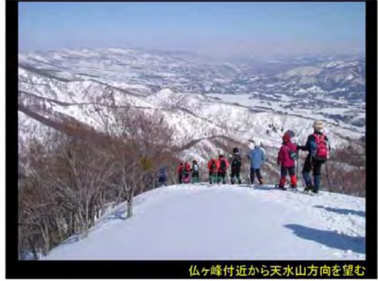
仏ヶ峰付近から天水山方向を望む