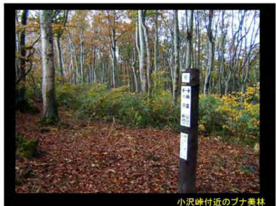
小沢峠付近のブナ美林