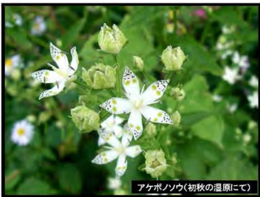
アケボノソウ(初秋の温原にて)