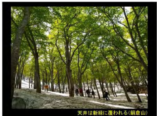
天井は新緑に覆われる(鍋倉山)