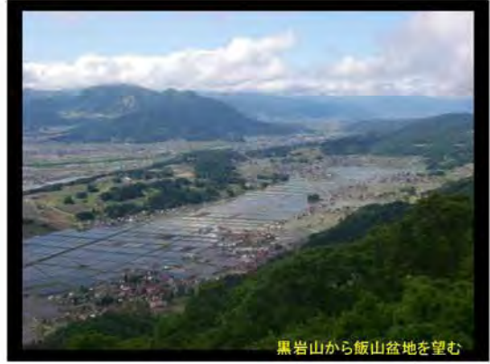
黒岩山から飯山盆地を望む