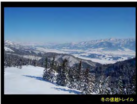
冬の信越トレイル