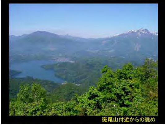
斑尾山付近からの眺め