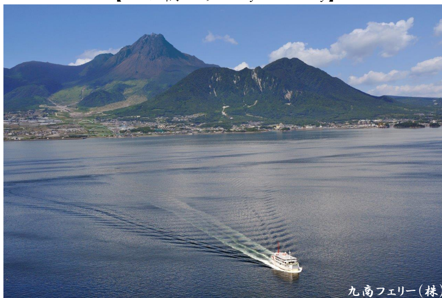
島原港沖の上空から(※単胴船のため、航跡の太い泡の帯は2本)

九商フェリーでは、島原港～熊本港の航路上のあらゆる区間で“ 東面の雲仙岳 ”が眺望できます。本航路から見える 雲仙岳 は概ね左右対称で、鷲や鷹がこちらを向いて翼を広げているような、左右に長い裾野が特徴的です。火山島のような島原半島に刻々と近づいていく情景は、“ジュラシックパークの恐竜島に向かっているようだ”と表現する人もいます。また、航路からは 阿蘇山 も眺望できることがあり、 阿蘇山と雲仙岳 の間の歴史的な 大三角形 (※阿蘇地域のページ参照)を視覚的にイメージすることが可能です。