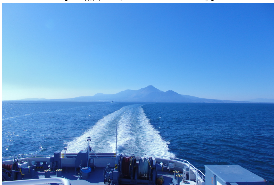
熊本港沖の船上から(※双胴船のため、航跡の太い泡の帯は3本)

熊本フェリーでは、熊本港～島原港の航路上のあらゆる区間で“東面の雲仙岳”が眺望できます。本航路から見える雲仙岳は概ね左右対称で、鷲や鷹がこちらを向いて翼を広げているような、左右に長い裾野が特徴的です。火山島のような島原半島に刻々と近づいていく情景は、“ジュラシックパークの恐竜島に向かっていているようだ”と表現する人もいます。また、航路からは阿蘇山も眺望できることがあり、阿蘇山と雲仙岳の間の歴史的な大三角形(※阿蘇地域のページ参照)を視覚的にイメージすることが可能です。