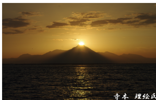
松尾町の海岸から