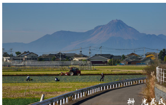
白川河口付近から

●熊本市の観光情報はこちら ⇒ 熊本市観光政策課 https://kumamoto-guide.jp/