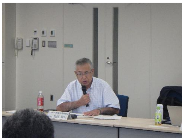
第 21 回ブロック協議会の様子