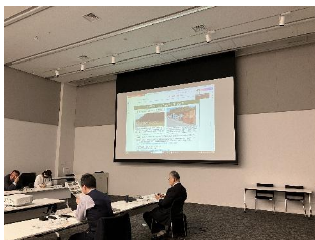
第 22 回ブロック協議会の様子