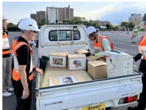
ワークショップ、屋外訓練の様子