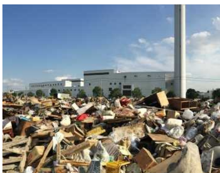
平成27年9月15日撮影 茨城県常総市 一次仮置場の搬入状況