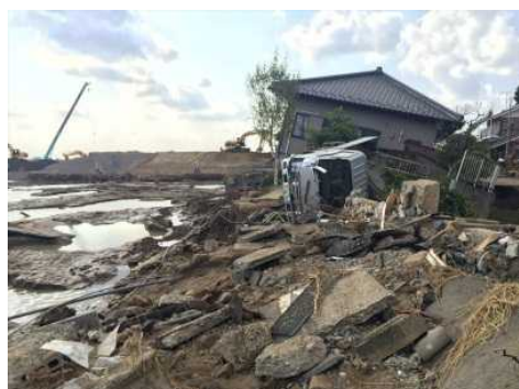
平成27年9月15日撮影 茨城県常総市 被災状況