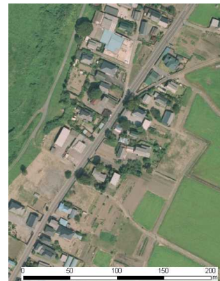
国土地理院地図(オルソ画像)