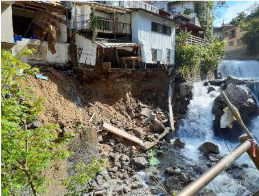
9月21日：由布市災害現場