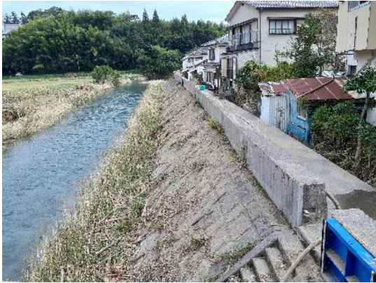
9月22日：延岡市災害現場（五ヶ瀬川の支流）