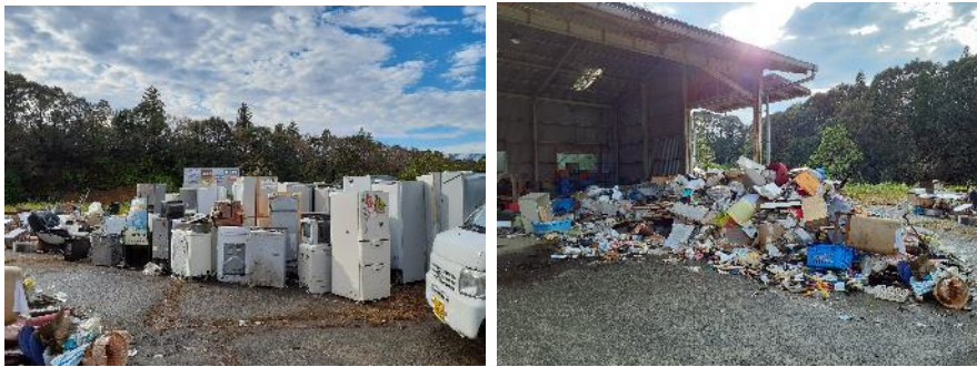
9月27日：日向市 仮置場