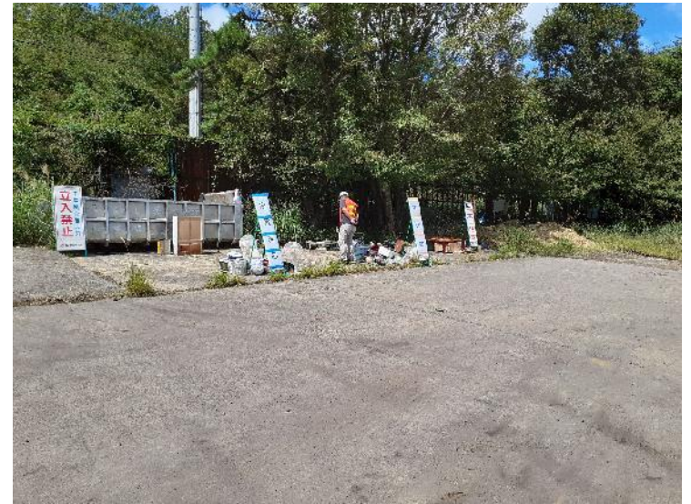
9月21日：由布市仮置場