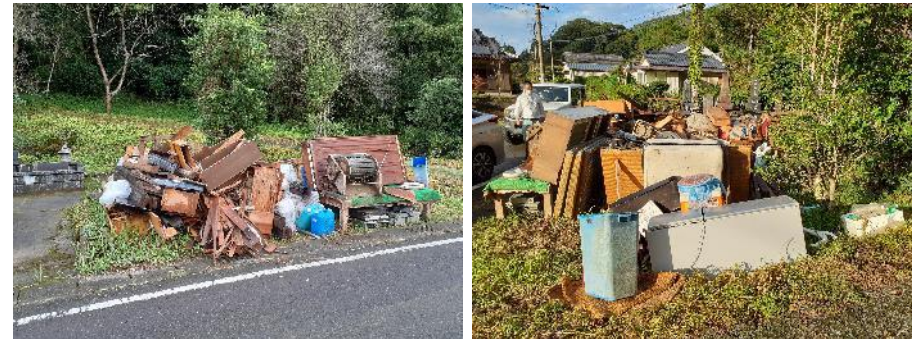
9月27日：日向市 自主仮置場