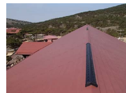
10, 屋根補強工事完了