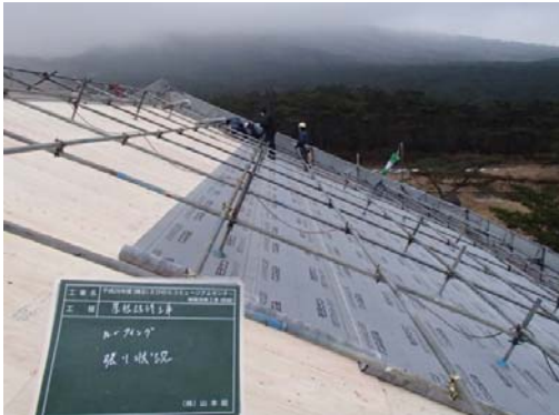
2, ルーフィング張り