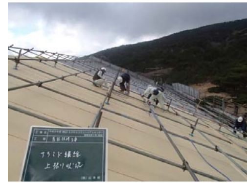
7, アラミド繊維・2層目