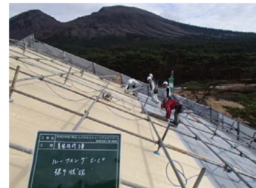
8, ルーフィング張り