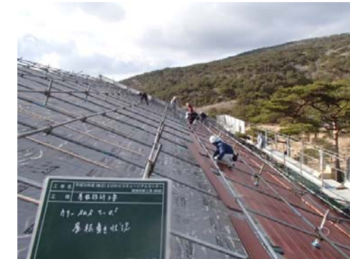
9, ステンレス屋根葺き