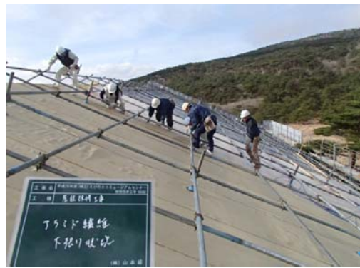
6, アラミド繊維・1層目