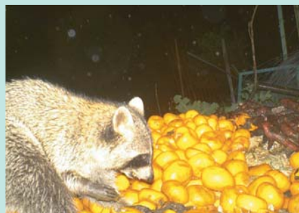
▲ 廃棄ミカンを食べるアライグマ。廃棄する農作物を放置しているとアライグマを呼び寄せる原因となります。

防護壁や防護ネットを設置していても、それらを登って侵入するため、新たな防除対策が必要となります。