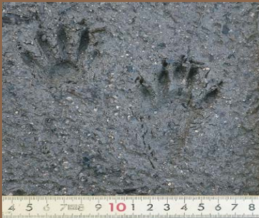
湿地に残ったアライグマの足跡。 ◀ 左：前足 右：後ろ足

森林の水辺を好み、農耕地や市街地周辺にも出没します。特にため池の流入部、樹林内の湿地や溪流などで多く確認されています。夜行性で昼間は暗い所に隠れているためあまり目撃されることはありません。行動圏は 40～100ha とされています。