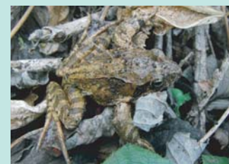
▲ ヤマアカガエル 日本固有種。平地から山間部に生息し、池沼・湿地の浅いところに産卵します。

また、他の動物に対して感染症や寄生虫を媒介する可能性があり、希少な野生動物の減少など、日本の生態系へ重大な被害をもたらすことが懸念されています。