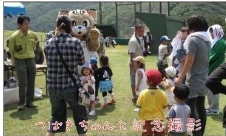
つばきちゃんと記念撮影

朝からどんより空で雨が降るか心配でしたが、祈りが通じたのか昼には青空がひろがっていました♪佐護のバードウォッチング公園のまわりを歩くとサギ類やシギ類などいろいろな鳥たちが田んぼに集まっていた♪