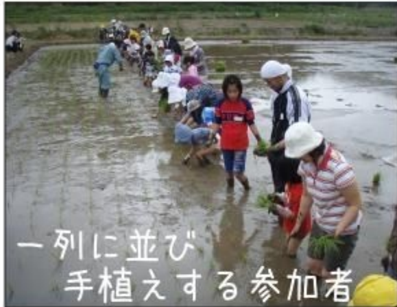
一列に並び手植えする参加者

今年も佐護小学校で「田んぼ楽校」が、田ノ浜で「対馬ヤマネコ田んぼの学校」が開校しました。佐護小学校では、種まき、泥んこ学習、田植え体験、田んぼの周りの生き物調査が行われ、生徒たちは田んぼの中でどろんこになりながら体いっぱい泥の感触や匂い、温度を楽しんだり、実際に田植えを行って米作りの楽しさや大変さを味わっていました。また田ノ浜地区では大人も子供もあわせて約六十名の方が参加し、田植え体験、田んぼの周りの生き物調査を行いました。生き物調査では、メダカやドジョウ、ウナギ、カメなどを捕まえたり牧草地でネズミの巣を発見するなど、田んぼが色んな生き物を育んでいる場所だと実感することができました。 普段田んぼに目を向けることの少ない人たちが田んぼと触れあうことで、自然の大切さについて考え、いつも食べるお米が数倍おいしくなるような機会になればいいなあと思いました。どちらも今から収穫の時期が楽しみです☆