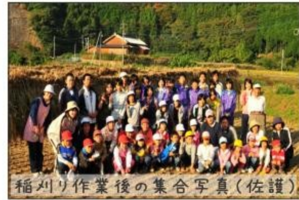
稲刈り作業後の集合写真(佐護)