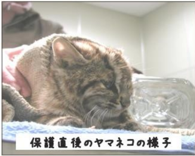
保護直後のヤマネコの様子

センターで治療した結果、一時は回復の兆しが見えましたが、翌日に死亡が確認されました。死亡したヤマネコは、去年春生まれの雄で、衰弱死と診断されました。まだ若い個体だったので、回復して野生で立派に生きてほしかったのですが、とても残念です。