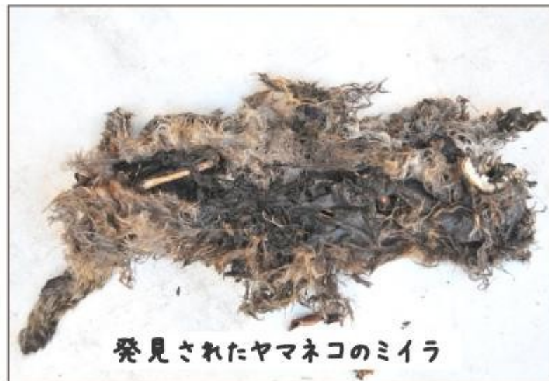
発見されたヤマネコのミイラ

上県町佐護の林道にて骨と皮だけのミイラ化したヤマネコの死体が発見されました。このようにミイラ化されたものが発見されるケースは珍しいです。