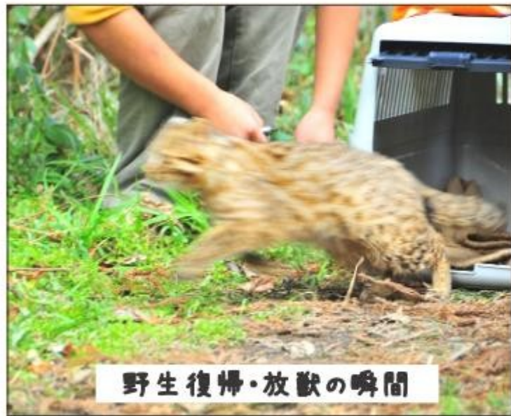
野生復帰・放獣の瞬間

上県町佐護の民家倉庫でヤマネコが保護されました。少し痩せていましたが、幸い健康状態に問題はなく、センターで約二週間療養した後、保護された近くの山へ帰ることになりました。 このヤマネコは昨春生まれの雄で、親離れしたばかりです。これから自分で餌を捕り、立派に成長し、野生のヤマネコとして堂々とたくましく生きてほしいと思います。