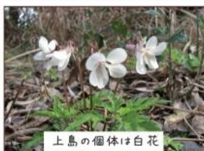
上島の個体は白花

2008年度も残りわずかとなりました。皆さま、風邪などひいていませんか?やまねこセンターは皆さまのお陰で今年も無事一年を終えることができそうです。感謝です。(うえやま。)