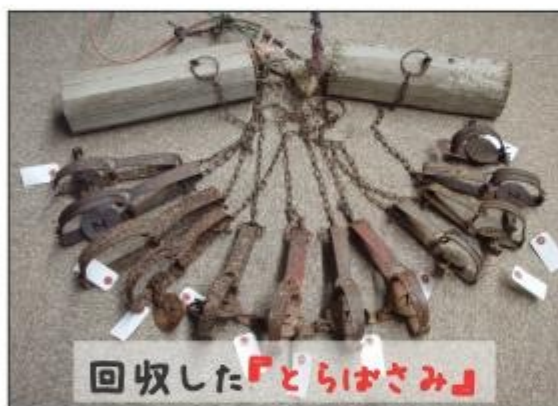
回収した「とらばさみ」

冬は、動物による鶏被害が多発する時期です。鶏が動物に襲われた場合、また被害が続いてお困りの場合は当センターにご連絡ください。