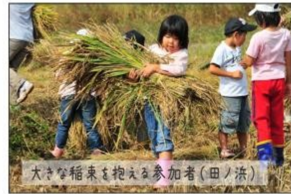
大きな稲束を抱える参加者(田ノ浜)

◆田ノ浜地区・佐護地区 田んぼの学校収穫祭♪ 今春から上県町田ノ浜地区と佐護小中学校で実施している田んぼの学校で稲の収穫体験が開催されました。十月十九日、田ノ浜地区の田んぼの学校では、お米の色が違う五種類の稲穂が見事に実り、約六十人の参加者が地元の方と一緒に鎌を使って稲を刈り取り、束ね、稲束を稲架に干しました。参加者の中には自分の背丈くらいある大きくて長い稲束を一生懸命運ぶ子供の姿もありました！ 十月二十日には、佐護小中学校による稲刈り、稲架干し体験を実施しました。中学生は下級生にやさしく作業のやり方を教えていました。子供達は田んぼの学校を通して「お米を作る」楽しさと大変さを学んでくれたのではないかと思います。今年のお米は豊作。今回の田んぼの学校に関わったすべての人が対馬の恵みに感謝し、今年のお米のようにすくすく育ってくれたらと願っています。