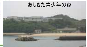
あしきた青少年の家

環境問題を解決するために環境教育の重要性が認識されています 一人一人が環境に配慮した行動をとることが問題解決のための大きな一歩です あなたも環境教育に取り組むリーダーを育成する研修に参加してみませんか？