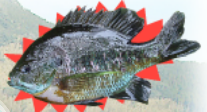
ブルーギル（外来魚）