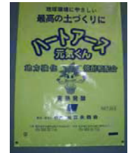
焼酎粕入りバーク堆肥