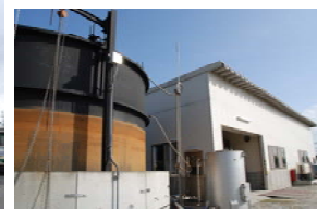
メタン発酵処理施設