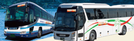
※バス車体に上のステッカーが付いています。 ※バス車体の写真はイメージです。