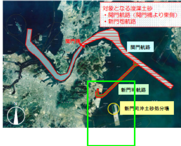
枠囲みの部分の拡大図