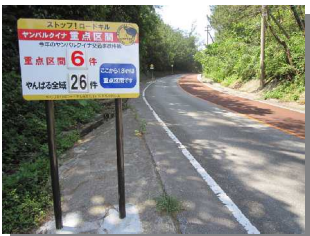
重点区間看板の設置