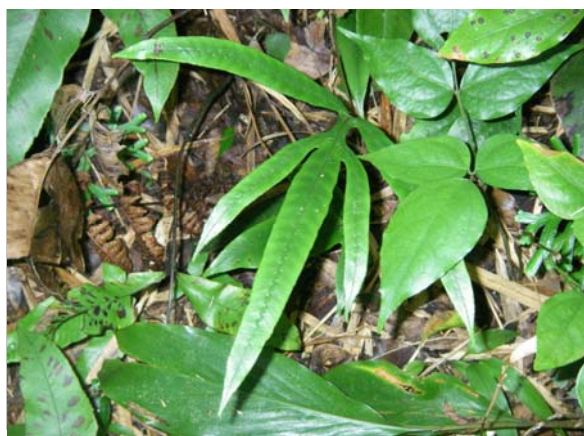
<重要種 オオギミシダ(シンガシラ科)> 国RL:VU、沖縄県RDB:VU