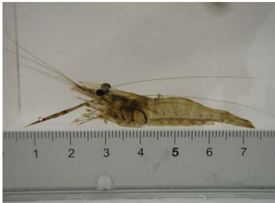
ミナミテナガエビ