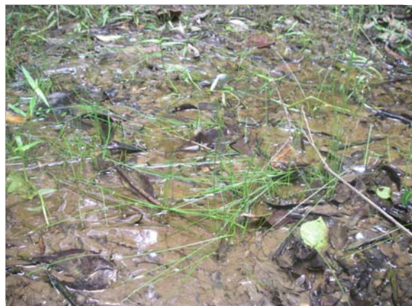
<重要種 シカクイ(イグサ科)> 国RL:一、沖縄県RDB:DD