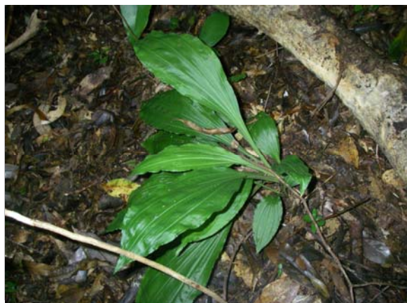
<重要種 ツルラン(ラン科)> 国RL:VU、沖縄県RDB:VU