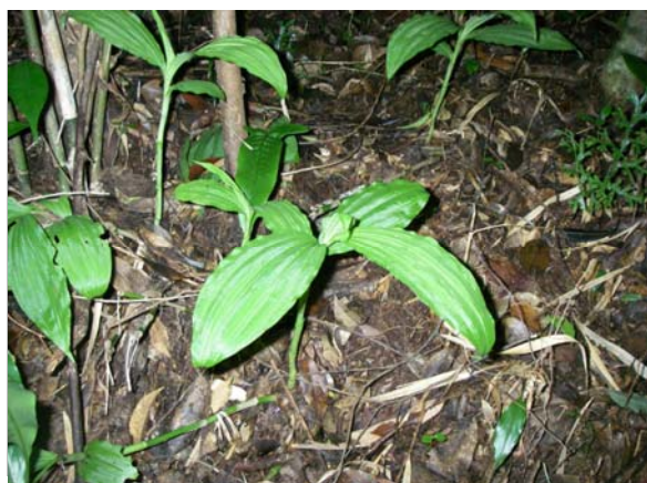
<重要種 トクサラン(ラン科)> 国RL:NT、沖縄県RDB:-