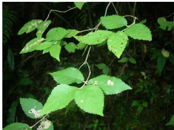
<重要種 オキナワヤブムラサキ(ムラサキ科)> 国RL:VU、沖縄県RDB:VU