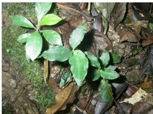
<重要種 クニガミシュスラン(ラン科)> 国RL:EN、沖縄県RDB:EN