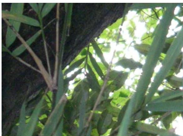
<重要種 オキナワセッコク(ラン科)> 国RL:EN、沖縄県RDB:CR