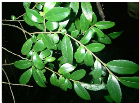
<重要種 マメヒサカキ(ツバキ科)> 国RL:CR、沖縄県RDB:CR