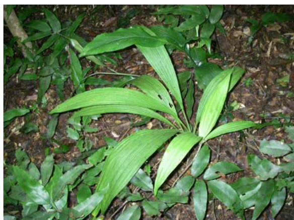
<重要種 レンギョウエビネ(ラン科)> 国RL:VU、沖縄県RDB:VU