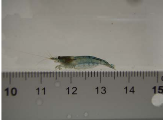
トゲナシヌマエビ