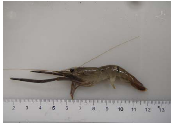
ヒラテテナガエビ