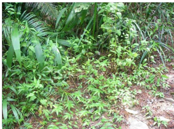
<重要種 オキナウラジロイチゴ(バラ科)> 国RL:—、沖縄県RDB:VU