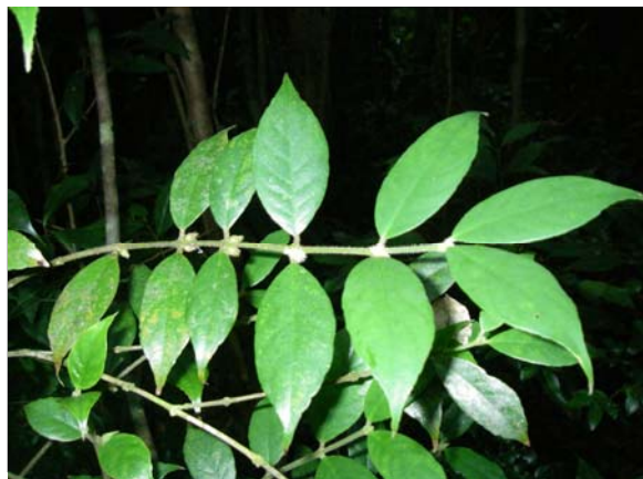
<重要種 ニコゲルリミノキ(アカネ科)> 国RL:NT、沖縄県RDB:VU