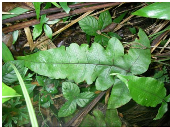
<重要種 アミシダ(オシダ科)> 国RL:—、沖縄県RDB:NT