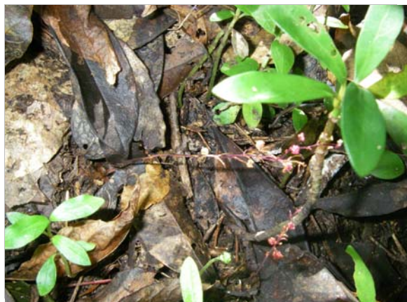
<重要種 ホンゴウソウ(ホンゴウソウ科)> 国RL:VU、沖縄県RDB:EN