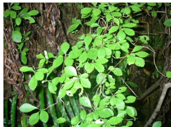
<重要種 リュウキュウコンテリギ(ユキノタ科)> 国RL:VU、沖縄県RDB:—