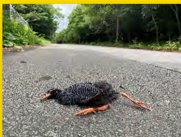
ヤンバルクイナ 国指定天然記念物 国内希少野生動植物種 環境省RL 絶滅危惧 I A類(CR)