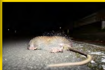
ケナガネズミ 国指定天然記念物 国内希少野生動植物種 環境省RL 絶滅危惧 I B類(EN)