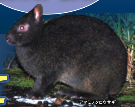
アマミノクロウサギ