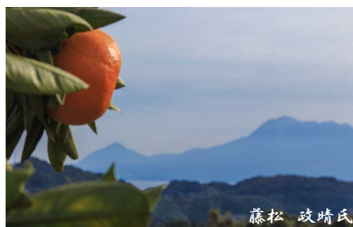
特産ミカンを食べているように見える雲仙岳