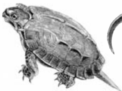
リュウキュウヤマガメ

雨の日には、リュウキュウヤマガメ、イボイモリ、シリケンイモリなどが路上に現れます。路面が雨でぬれて黒くなっているため確認しにくく注意が必要です。