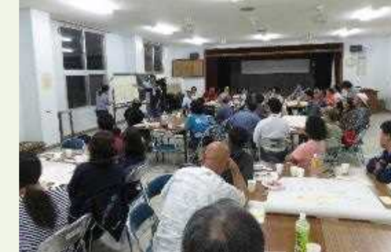
会場：上原多目的集会施設

自然の恵みが豊かな島 禁漁期間や禁漁区を設けて資源を休ませながら利用し、地産地消で地元のものホテルなどでも使ってもらおう。