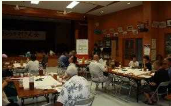
会場：白浜海人の家

子供ガイドの育成と専用通貨の仕組み作り 祖納・干立のように（伝統・文化の継承）語り継ぎや後継者の育成、住環境整備