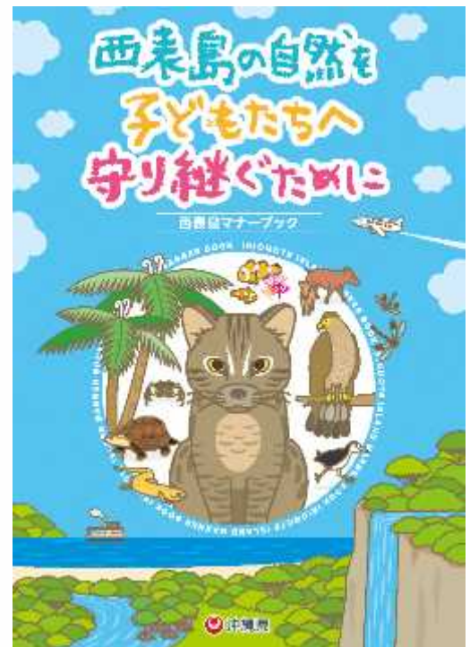
西表島マナーブックの表紙