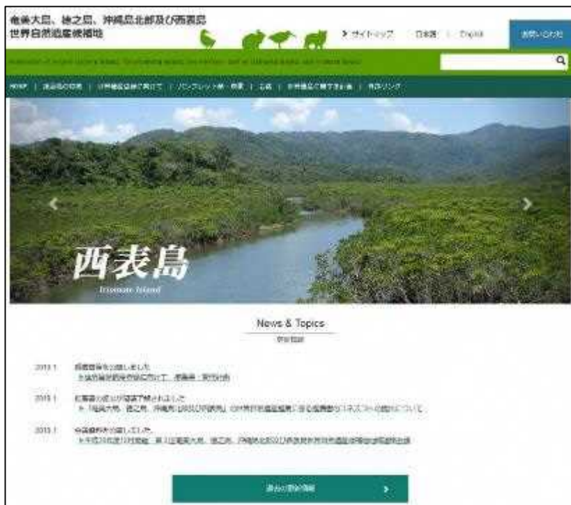
世界自然遺産候補地のホームページ

観光客向けのマナーブック「西表島の自然を子どもたちへ守り継ぐために」を作成しました。ゴミを持ち帰ることや車の制限速度を守ることなど、西表島を観光で訪れるにあたって守るべきルールやマナーをとりまとめたものです。船会社やJTAの協力を得て、チケットの購入時に全ての来訪者へ手渡しで配布することとしています。