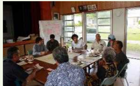
会場：古見の浦の里

子どもたちが帰って来たい島 地域の保育所の復活や共同売店で子育てのしやすい環境をつくる。山菜や独自の農産物を活かして仕事をつくる。