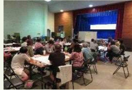
会場：竹富町離島振興総合センター