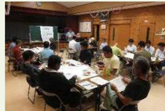
会場：船浮多目的施設

観光客に、島外ゴミ持ち帰り用の復路を配布したり、マイカップ持参者にサービスしたりする。