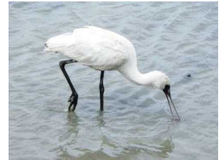
クロツラヘラサギ