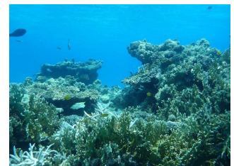
慶良間諸島のサンゴ礁