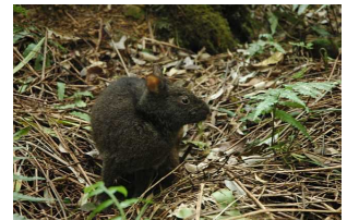
アマミノクロウサギ