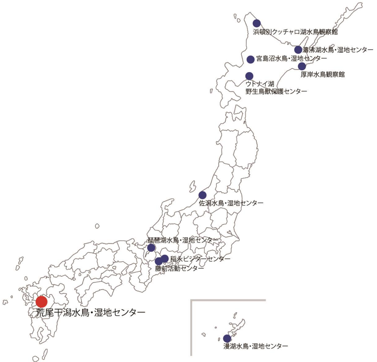
全国の水鳥・湿地センター位置図